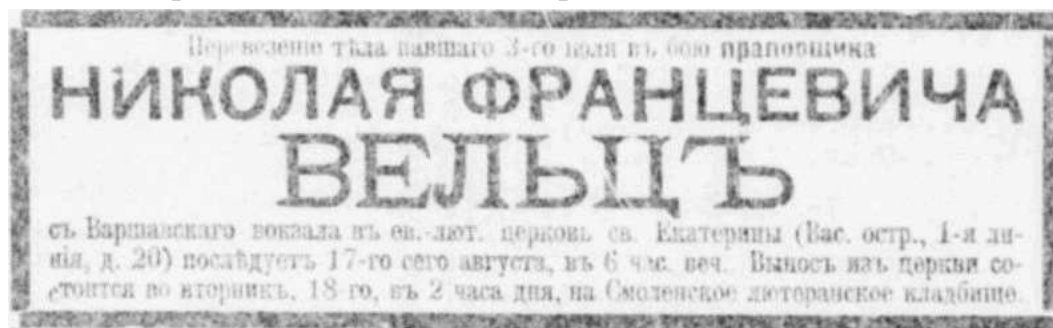
Фото 2.