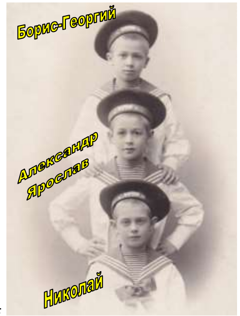
Братья Вельц 1903 год.

Окрестил младенца 18 апреля 1893 года на дому пастор евангел-лютеранской церкви Св. Екатерины док. Р. Вальтер именем Nicolai-Josepf-Julius Wölz .