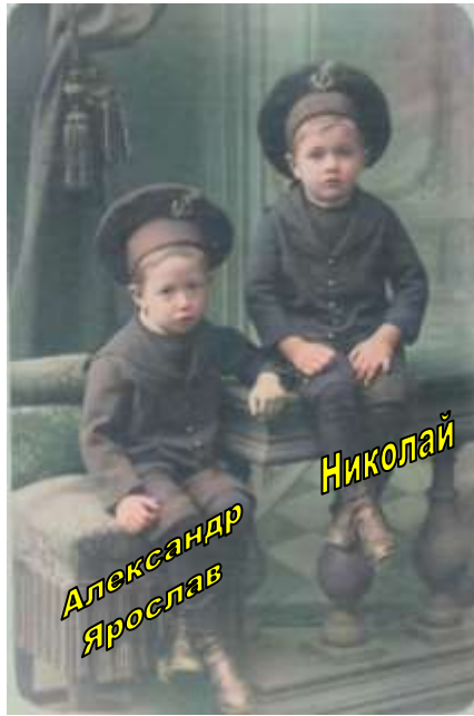
Братья Вельц 1897 год.